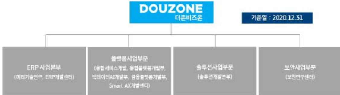
20201231_더존비즈온 연구개발 담당조직