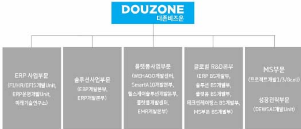
20241231_더존비즈온 연구개발 담당조직도