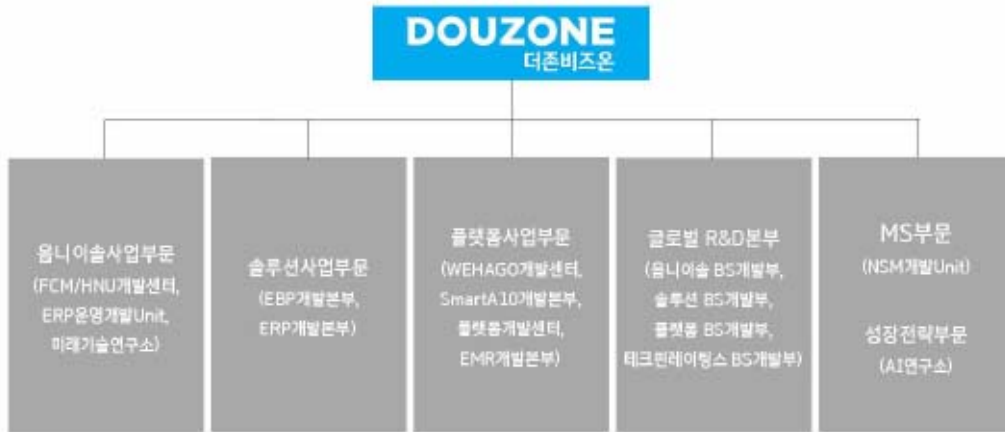
20250630_더존비즈온 연구개발 담당조직